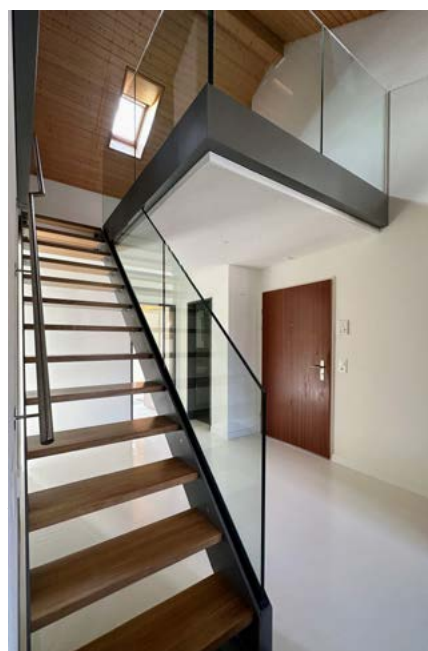
Treppengeländer mit eingefassten Stufen

Wir hatten die Aufgabe, eine bestehende Holzterrappe im Innenbereich neu zu planen. Diese sollte mit Stahlwangen, Glasgeländer und Eichenholzstufen realisiert werden. Die bestehende Situation wurde mittels 3D-Punktwolke aufgenommen und mit TopSolid'Steel verarbeitet. Solche Projekte sind ohne Hilfe von 3D Softwarelösungen richtig aufwendig und kompliziert. Bei Änderungswünschen oder weiteren projektspezifischen Aufträgen kann, ohne weitere Massnahmen vor Ort, in derselben Punktwolke weitergeplant werden.