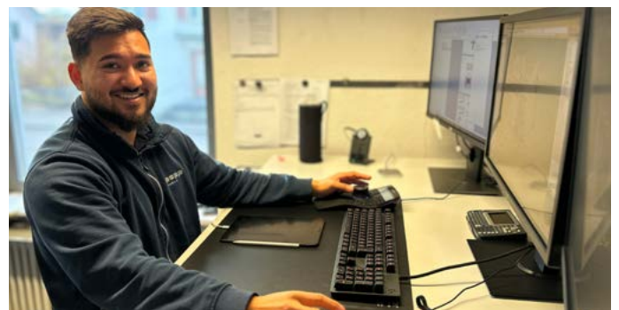
Die Anwendung von TopSolid'Steel bereitet täglich Spass.

Die Herausforderungen vor der Umstellung auf TopSolid'Steel waren signifikant. Änderungswünsche (rollende Planung) während der Planungsphase durch Architekten oder Bauherren waren zeitintensiv. Der steigende Bedarf an Änderungswünschen führte zu enormen Mehrleistungen. Kunden fanden es schwierig, sich in 2D-Plänen zurechtzufinden, sich das Bauteil vorzustellen, war zeitweise fast unmöglich. Mit TopSolid'Steel hat sich das erfreulich verbessert. Die Umstellung ermöglicht es, Projekte in 3D zu planen, zu visualisieren und Fehlerquellen in den Erwartungen zu reduzieren.